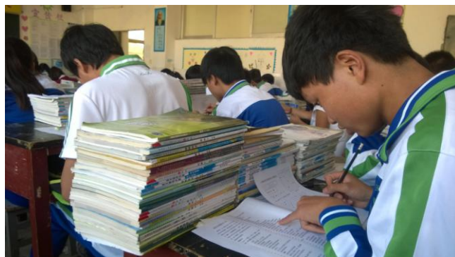
学生们班会课做心理问卷