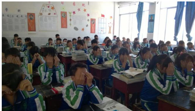
“小班”的工作之一，下午第一节课后检查眼保健操

担任 14 班的“小班”已有两星期了，几乎每个早晨和傍晚都会陪他们半小时直至自修开始。这半小时，最让我难忘的应该不是他们各个面带倦容或睡意，早早奔赴学校；应该不是他们偷偷摸摸，藏着掖着把早点带进了教室，偶尔饿了，饿了，埋头吃上几口；应该也不是他们赶着放学回家做饭，又急忙踩着点出现在班级门口，气喘吁吁；应该是他们尽管有千万个不情愿，满腹牢骚，但还是很守纪律地提前半小时到班级，读课文的，背单词的、专研习题的，等等。“锲而不舍，金石可镂，不忘初心，方得始终。”小班只想对你们说，早晚，你们都会成为划破那东方的“鱼肚白”，给人温暖和希望。