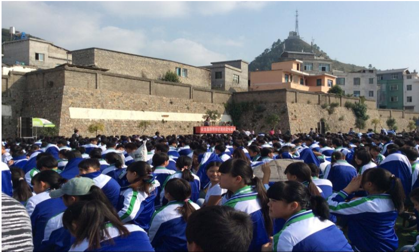
学生们听“安龙一中预防邪教大会”报告